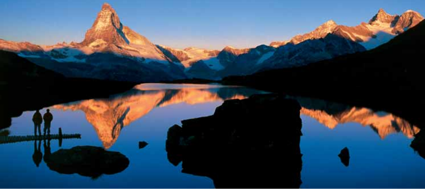
Lago Stelli com vista para o Matterhorn, Valais