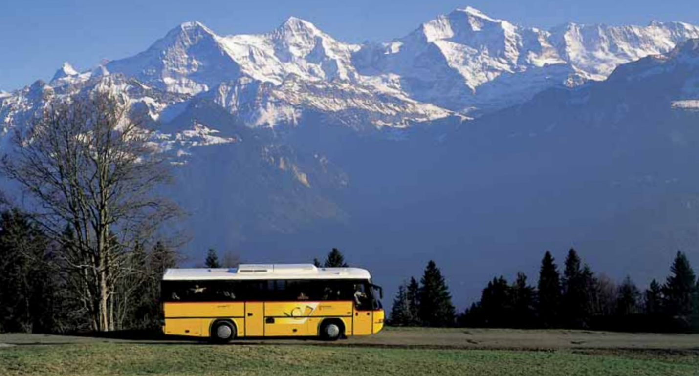
Ônibus passando por Beatenberg com uma panorâmica do Eiger, Mönch e Jungfrau, Bernese Oberland

Informações detalhadas podem ser obtidas no site www.rail.ch/baggage . A partir de qualquer aeroporto no mundo você pode despachar suas malas para mais de 50 estações ferroviárias na Suíça ( Fly Rail Baggage ). Ao se despedir da Suíça, onde pode também receber seu cartão de embarque (serviço não disponível com todas as companhias aéreas e os vôos para os EUA estão excluídos). O custo é de CH 20,- tanto para o Fly Rail Baggage como para o check in nas estações de trem.