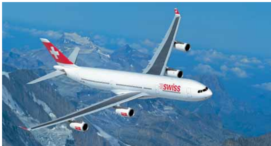
Swiss International Air Lines, nova aeronave A340

Economize uma diária de hotel e viaje no trem noturno. Muitas cidades europeias