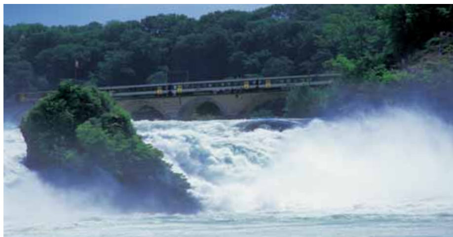
As cachoeiras do Rio Reno perto de Schaffhausen, leste da Suíça