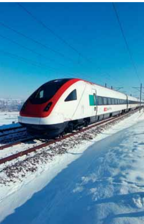
SBB ICN tilting train